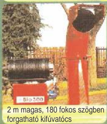
2 m magas, 180 fokos szögben forgatható kifúvatós