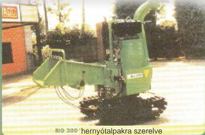
BIO 300 hernyótalpakra szerelve