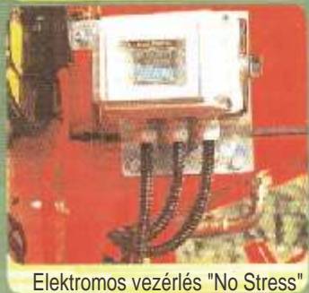
Elektromos vezérlés "No Stress"