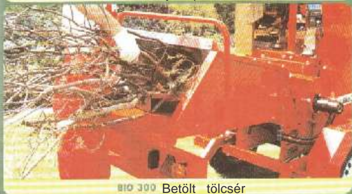
BIO 300 Betölt tölcsér